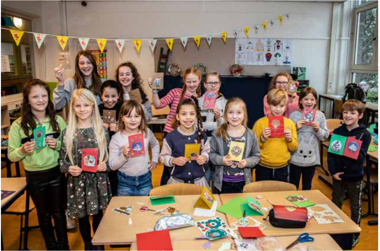
Wilhelmina school maakt kerstkaarten voor bewoners van de Savelberg

‘Ondersteuning gericht op optimale deelname op school, op de arbeidsmarkt, thuis, op de club of vereniging in de buurt.’