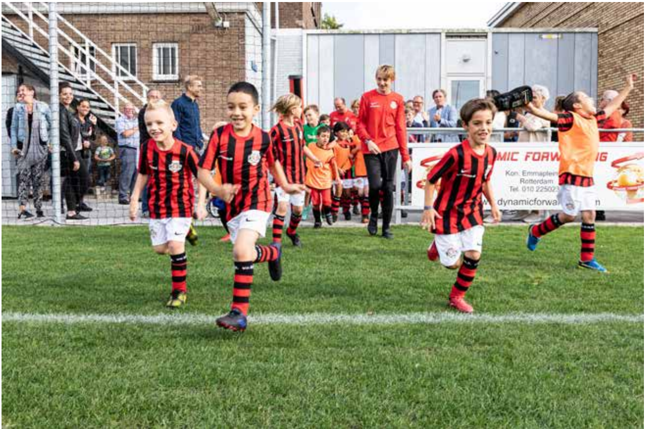
Gouds sportveld ona met diverse sportende kinderen

‘Meedoen in reguliere clubs & verenigingen is vanzelfsprekend. Er zijn geen fysieke, sociale of financiële belemmeringen meer.’