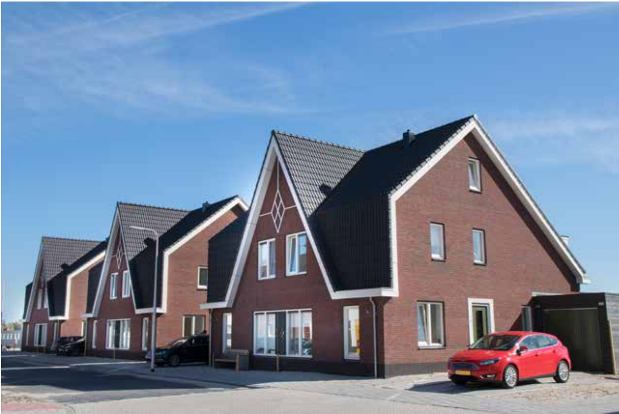
De wijk Westergouwe is rolstoelvriendelijk gebouwd