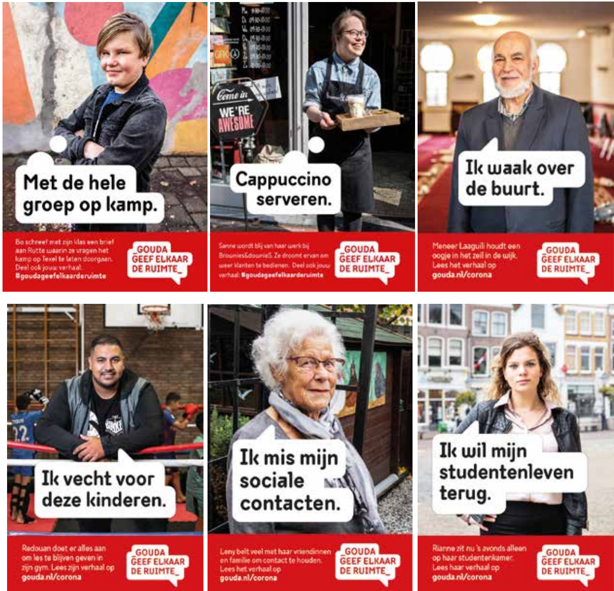
Diversiteit zichtbaar in de coronacampagne

Bij de coronacampagne ‘Gouda, geef elkaar de ruimte’ is geprobeerd om een mooie afspiegeling van de Goudse samenleving in beeld te brengen. Het resultaat was een erg diverse campagne op het gebied van leeftijden en culturen.