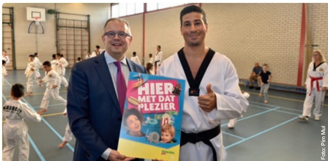
Start van de Stadspas en Kindpakket bij Taekwondo Akabbouz in Gouda, één van de deelnemende sportverenigingen.

“Ik ben heel blij met de resultaten op het gebied van betaalbare woningen en de extra sociale woningbouw die we realiseren. Een voorbeeld is de transformatie van het oude stads-kantoor in de Agnietenstraat in betaalbare jongerenhuisvesting. En waar ook mensen uit bijvoorbeeld beschermd wonen een plek kunnen vinden. Maar ook de introductie van de Rotterdamspas als Stadspas van Gouda is een mooi resultaat. Door de introductie van het Kindpakket kunnen kinderen die dat nodig heb-