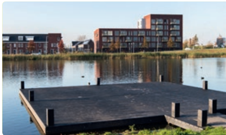
De nieuwe woonwijk Westergouwe met woningaanbod voor iedereen.

“Het leukst en belangrijkste zijn mijn gesprekken met Gouvenaars”