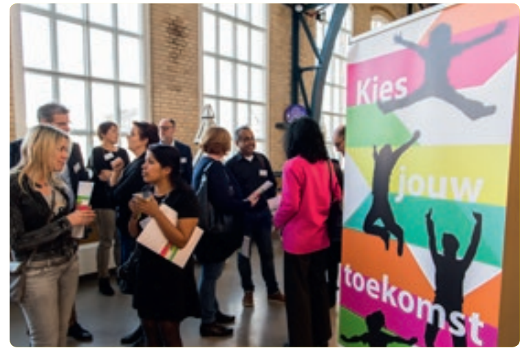
Samen met partners werken aan een sluitende aanpak van jeugdwerkloosheid.

ben ook meedoen. Hiermee kunnen ze nu een winterjas of sportkleding kopen. Voor kinderen is er de schoolkostenregeling en de mogelijkheid om te sporten of muzikles te volgen. Tot slot is het in eigen beheer nemen van de schuldhulpverlening belangrijk. Samen met partners in de stad kunnen we dan meer maatwerk leveren en voorkomen dat mensen tussen wal en schip vallen.”