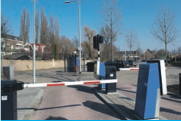
Ook de slagbomen bij het parkeerterrein Vossenburchkade verdwijnen per 1 januari.

Gouda wil meer service en gebruiksgemak bieden aan parkeerders. Naast de huidige betaalmogelijkheden bij de automaat, kunt u vanaf 21 december ook met de mobiele telefoon betalen met een app, via sms of door te bellen.