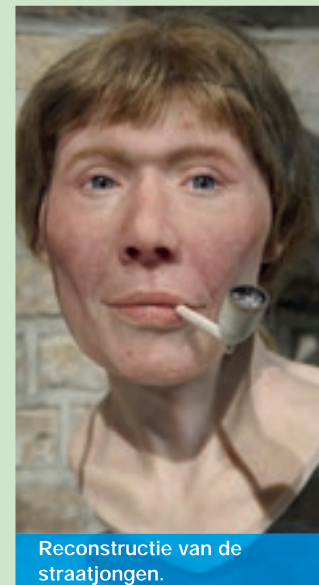
Reconstructie van de straatjongen.

Uit de grafboeken blijkt niet wie deze jongeman is. Alles wijst op een begraving van iemand uit de sociale onderklasse. En mensen uit die klasse werden normaal gesproken juist niét in de kerk begraven. Waarom lag deze jongen