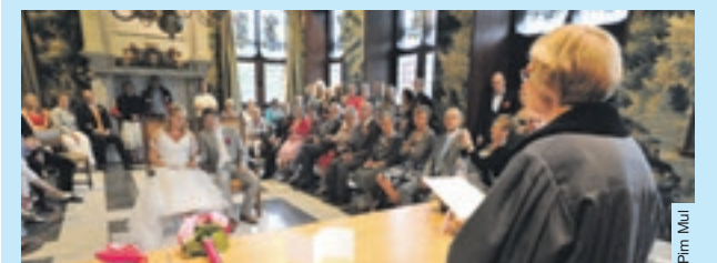
Oude stadhuis van Gouda.

De volgende locaties zijn aangemerkt als officiële trouwlocatie: Partycentrum Le Patapouf, het oude stadhuis, de Spiegeltent,