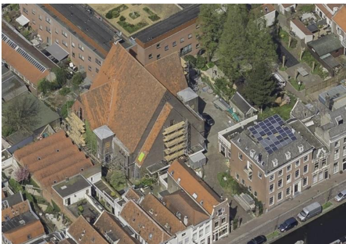
Foto 2: Turfmarktkerk 19-04-2018.

De gemeente heeft KB gesommeerd om voorzieningen aan te brengen om de stabiliteit van de Turfmarktkerk te borgen. Door c.q. in opdracht van KB werd in dit kader een steigerconstructie in de kerk opgebouwd en zijn steigers opgetrokken voor enkele delen van de buitengevels (zie foto 2). De gemeente en de door haar ingeschakelde specialisten waren echter van mening dat de door KB getroffen voorzieningen, onder meer vanwege de voortschrijdende aantasting van de (draag-)constructie, ontoereikend waren om de stabiliteit van de kerk te borgen en dat direct gevaar bestond voor instabiliteit/instorting van de kerk. Op basis van voornoemde constatering is de gemeente op 24 oktober 2018 overgaan tot de toepassing van bestuursdwang.