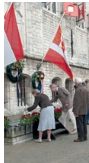
Stichting 4 en 5 mei

Op 4 mei maakt een Britse Dakota vanuit Engeland een herdenkingsvlucht boven Nederland. Om ongeveer 15.35 uur vliegt het WOII-vliegtuig over de Markt in Gouda.