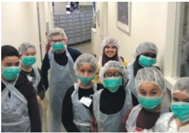
Leerlingen Goudse Weekendschool namen een kijkje achter de schermen bij apotheek Heerkens