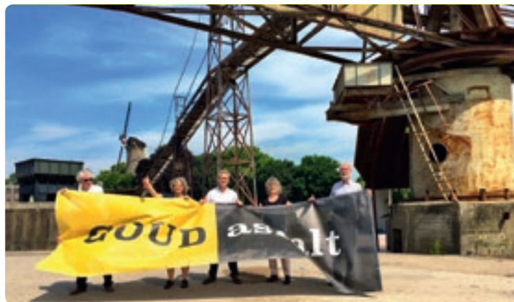
De initiatiefnemers van GoudAsfalt op het terrein.

“Gouda bruist dankzij haar initiatiefrijke inwoners, organisaties en ondernemers.”