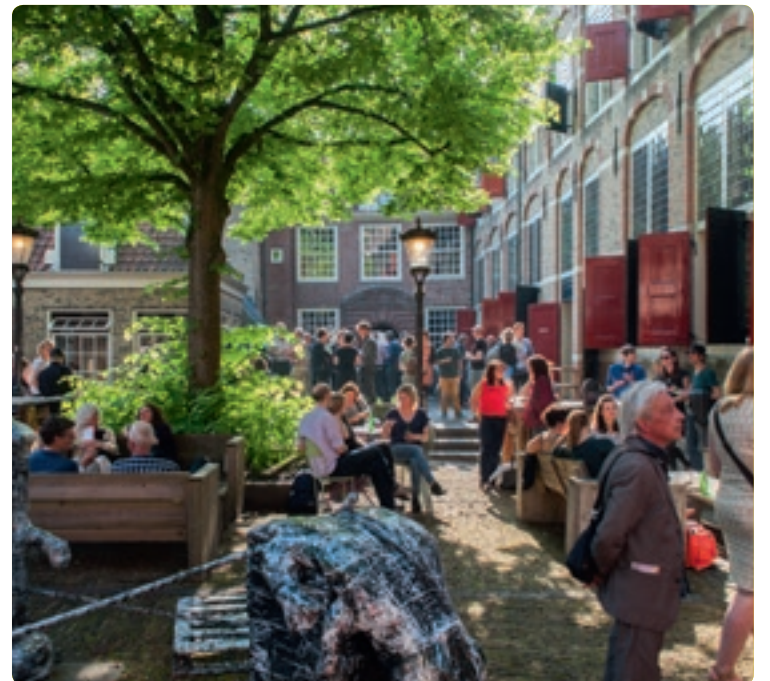
Het Weeshuiscomplex dat een herbestemming krijgt.

“Gouda is een stad waarin samenwerken centraal staat. Er zijn veel vrijwilligers actief om van Gouda een leukere, leefbare, zorgzame stad te maken. Het is juist die samenwerking die Gouda uniek maakt. Inspirerend vind ik bedrijven, inwoners en organisaties die met ideeën aan de slag gaan voor de stad van buurt tot stadsniveau.”