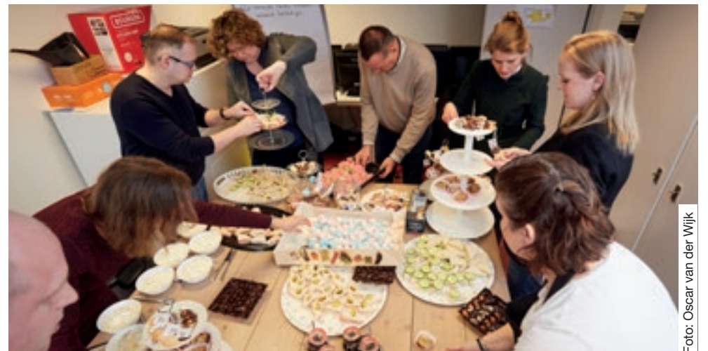
Burgemeester en wethouders in actie tijdens NLdoet bij Het Bruisnest, locatie Blekerssingel. Zij hebben gezamenlijk een high tea voorbereid met de medewerkers en vrijwilligers. Voor de high tea zijn buurtbewoners uitgenodigd. Kijk voor meer info over vrijwilligerswerk op www.goudvoorelkaar.nl .

De monteur van Quint & Van Ginkel is verplicht zich te legitimeren. De verwachting is dat de werkzaamheden in de wijk tot eind 2018 zullen duren.